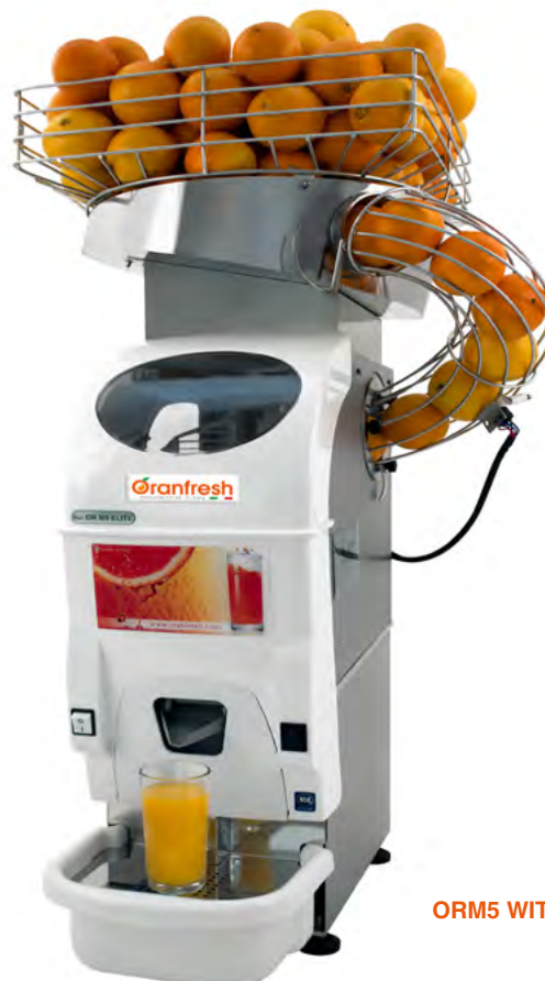
ORM5 WITH HOPPER